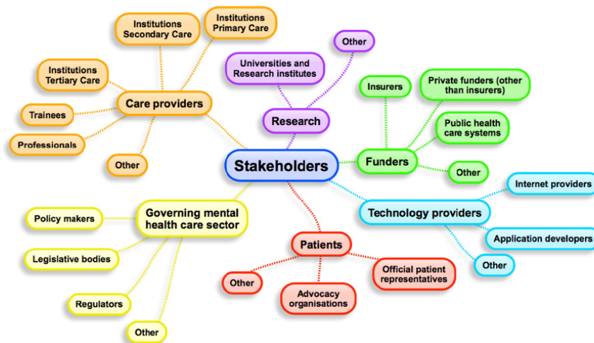
Fig. 1. Targeted stakeholder groups.

In total 764 organisations was contacted and 175 returned the questionnaire, corresponding to a 23% response-rate. The number of targeted organisations and response rates varied between countries (Poland 29/